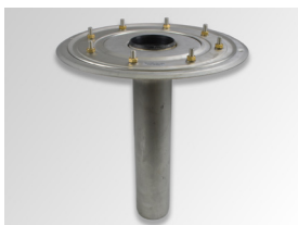
ACO Spin Flachdachablauf Unterteil