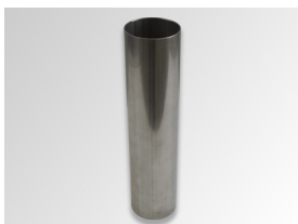
Optigrün-Ablaufdrossel ASF (Anstau-/Drosselrohr)