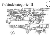
Geländekategorie III Vorstädte, Industrie- oder Gewerbegebiete, Wälder