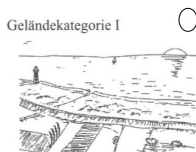
Geländekategorie I Glattes, flaches Land ohne Hindernisse