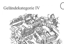
Geländekategorie IV Stadtgebiete; 15% der Fläche sind mit Gebäuden bebaut, deren mittlere Höhe 15m überschreitet

Besonders Exponierte Lage (z.B. einzeln stehendes Gebäude auf Anhöhen, Kuppen) ja nein