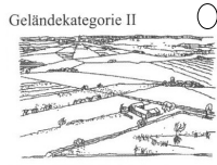
Geländekategorie II Gelände mit Hecken, einzelnen Gehöften, Häusern oder Bäumen, z.B. landwirtschaftliches Gebiet